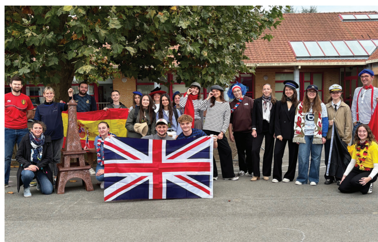
CVL Toussaint 2025.

Les dossiers complets seront à déposer par les demandeurs à la mairie au service jeunesse avant le 30 décembre 2025.